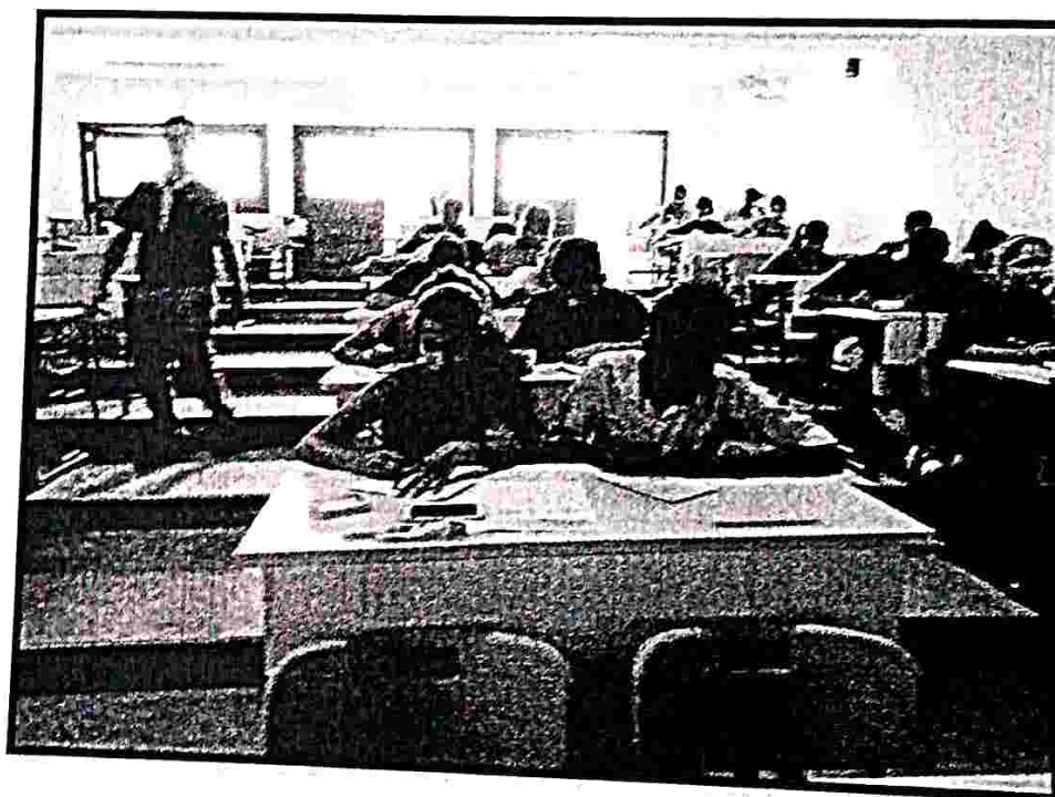
Participants of the event while performing activities