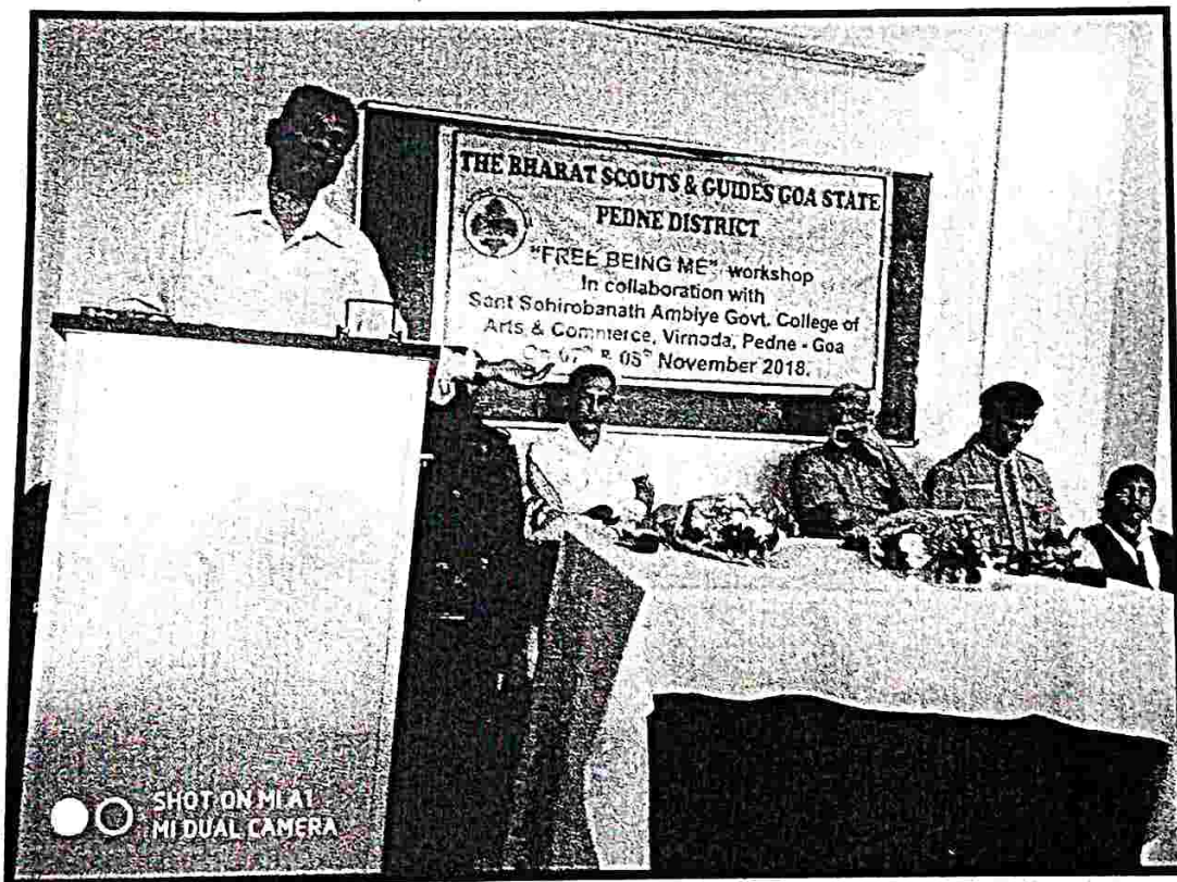
Principal addressing the gathering