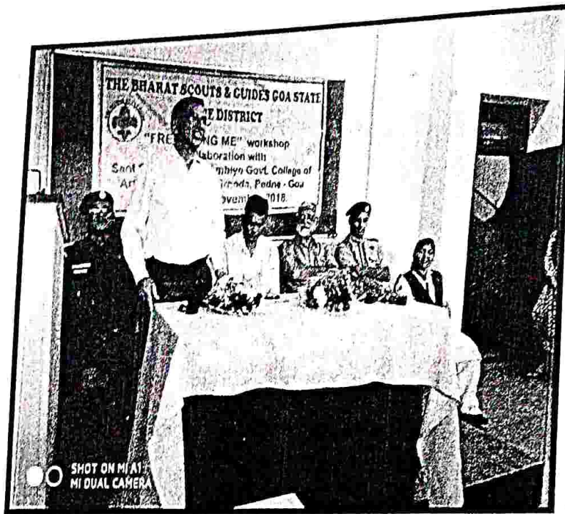
Vice-Principal addressing the gathering